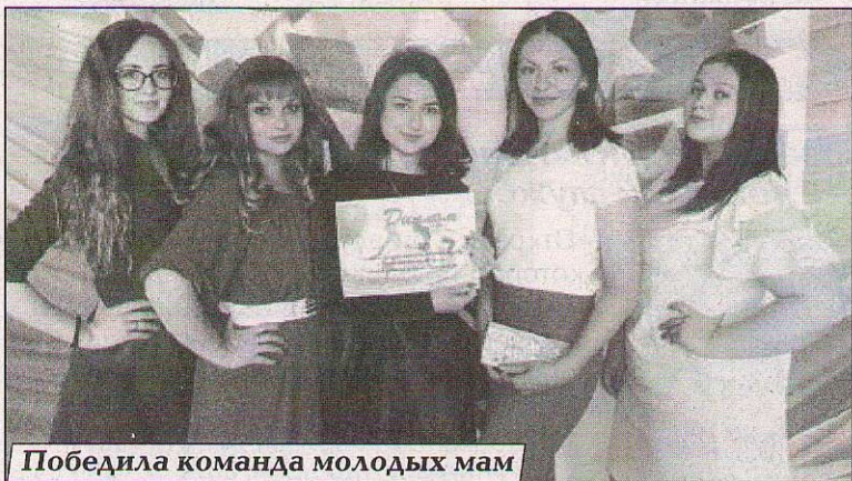
Победила команда молодых мам

В День молодежи на большесосновском стадионе «Юность» собрались команды Большесосновского, Черновского, Тойкинского, Полозовского, Левинского, Петропавловского сельских поселений на районный конкурс «Юность. Мастерство. Талант».