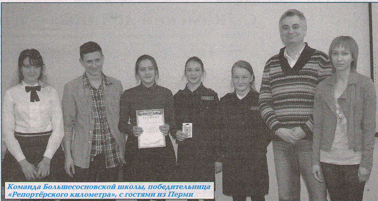
Команда Большесосновской школы, победительница «Репортёрского километра», с гостями из Перми